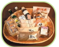
えちごそうる復興応援セット