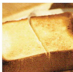
プレートトースト 260