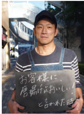
KARATTO (唐揚げ弁当) 店主