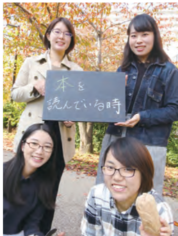
北野書店×専修大学課題解決型インターンシップ生のみなさん