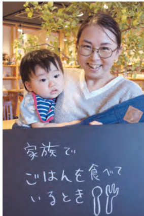
なみさん、えいすけくん 1歳