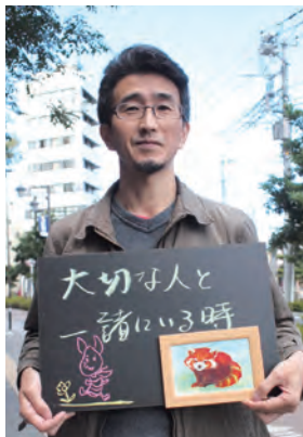
Town 光新川崎サービスショップ ShoshiA (さかえ) さん